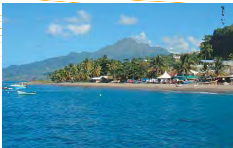
Martinique, Le Carbet

Guadeloupe : signature d'accords sur les prix de la grande distribution entre les enseignes (Carrefour, Champion, Cora, Match, Ecomax, Leader Price, Super U et Boisripeaux supermarché) et le collectif LKP. Une baisse de prix est actée impac-