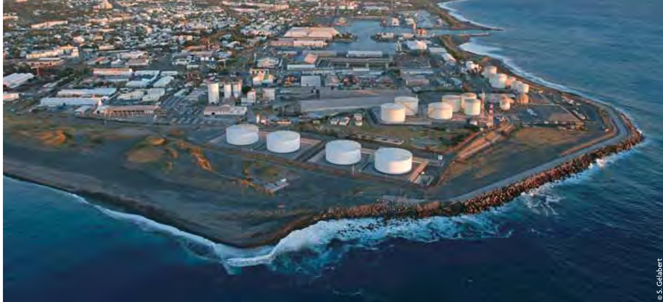
La Réunion, terminal pétrolier de la SRPP au Port