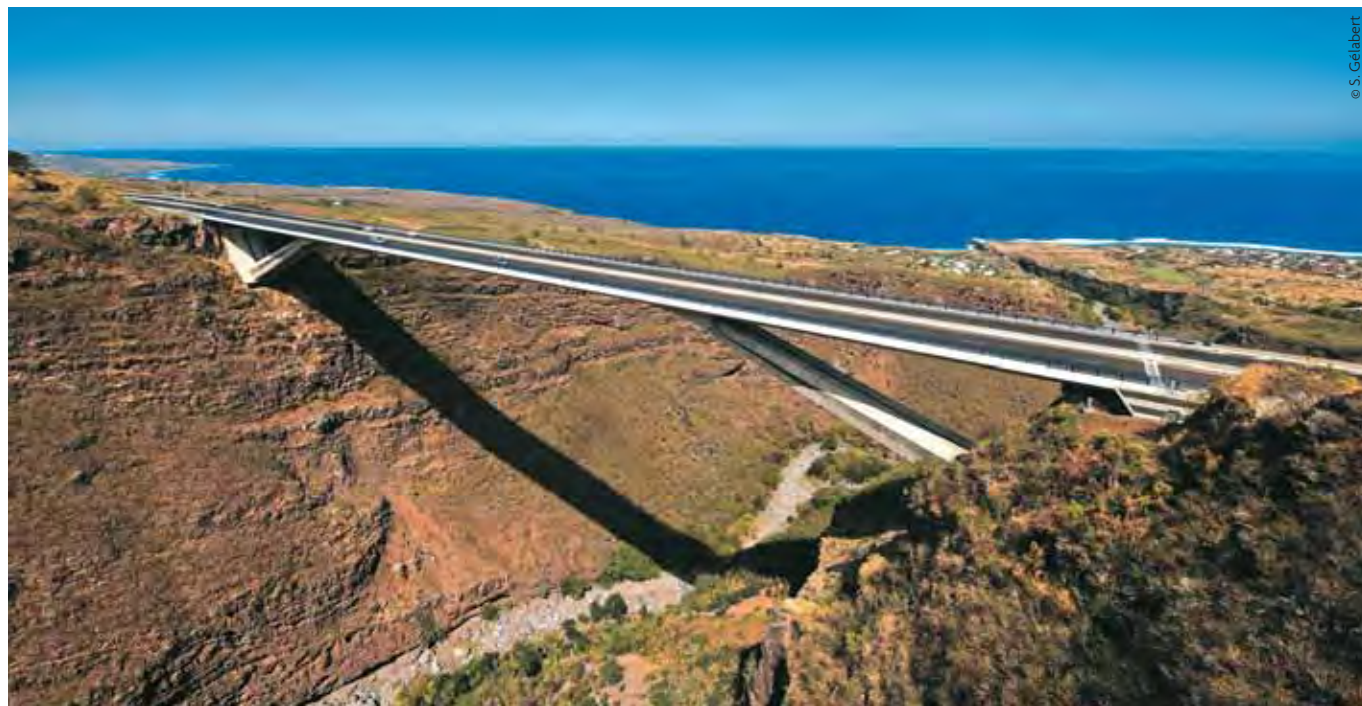
La Réunion, route des Tamarins

La Réunion : signature d'une convention relative à la médiation du crédit à La Réunion.