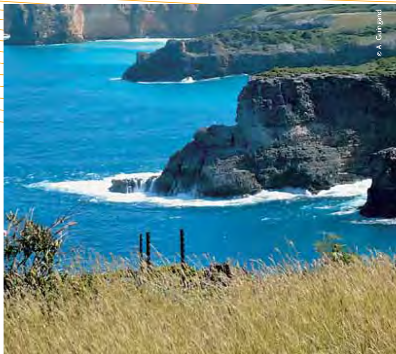
Guadeloupe, Pointe de la Grande Vigie - Anse-Bertrand